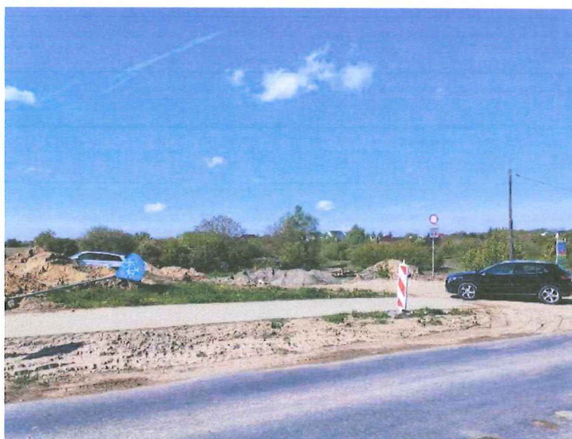
Tutaj będą ekrany akustyczne, a najbliższe zabudowania znajdują się za widoczną linią drzew.