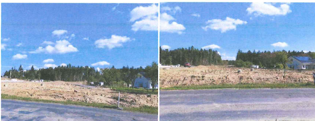
Odległość między domem, a drogą techniczną i rondem