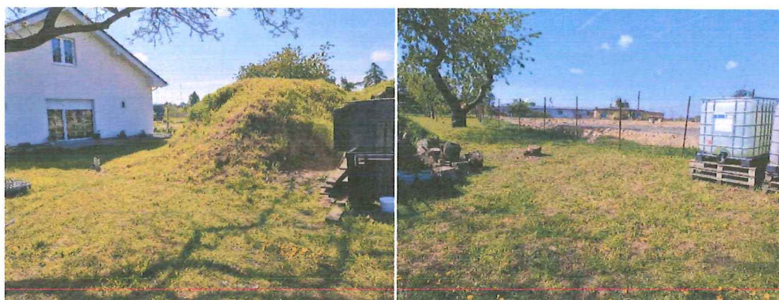
Odległość między domem, a ogrodzeniem – za ogrodzeniem widać drogę techniczną